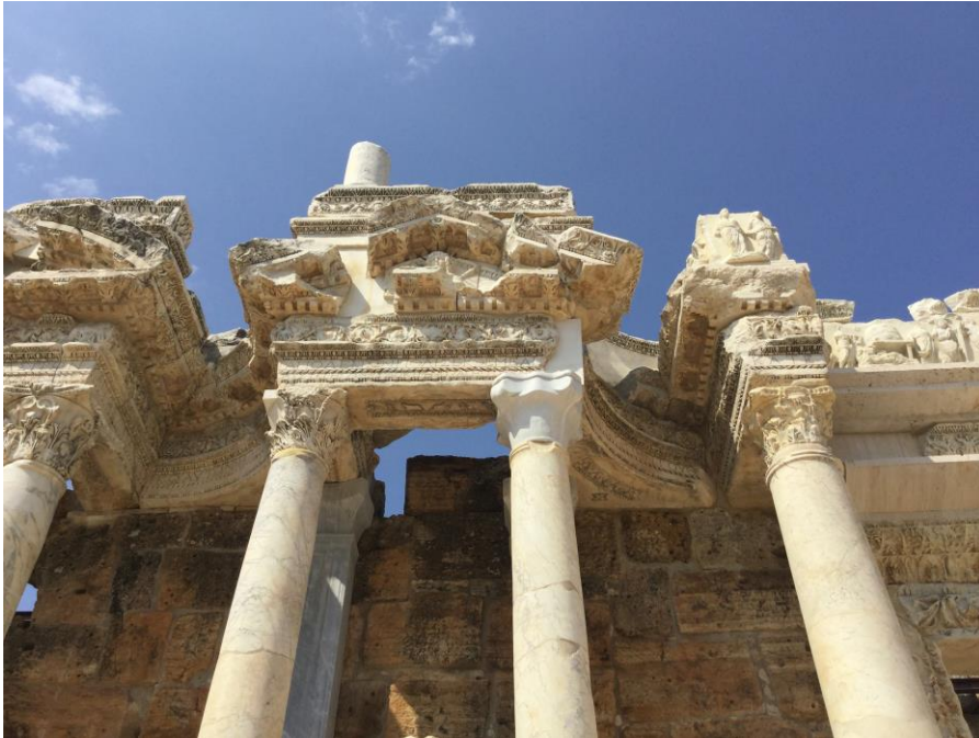
Hierapolis. Son restorasyonlardan sonraki hali

“Kamusal alan, özel alan. Türkiye’deki arkeolojik çalışmalara eğitim araştırma ve kazı’da İtalya katkısı”